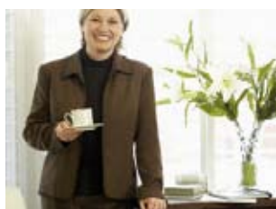
14 altijd het aanspreekpunt