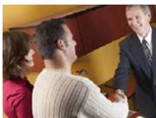
01 intake gesprek