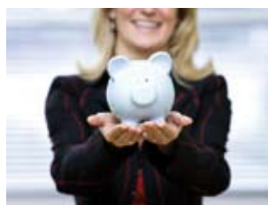
03 financiële mogelijkheden