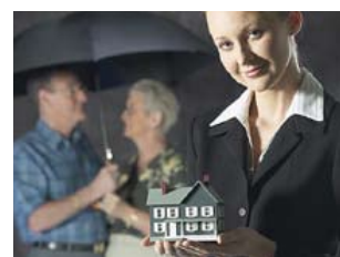
12 hypotheek en verzekeringen