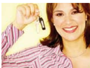
13 de overdracht