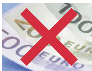
15 no cure -no pay