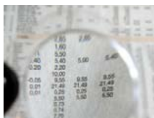
11 de kleine lettertjes